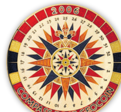
Exemple de géocoin, une «pièce de monnaie voyageuse» créée pour le jeu. Il en existe des centaines, qui provoquent une «collectionnite aiguë» chez certains géocacheurs. Thierry Furney

l'indispensable GPS, un téléphone mobile et un petit objet (porte-clés, sifflet, balle, etc.) qu'on troquera contre un autre dans la boîte. Il vaut mieux ne pas partir seul ou annoncer où l'on se rend. Et surtout, durant la promenade, ne pas oublier de lever le nez de son itinéraire. Cela permet d'ad-