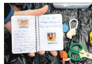
Porte-clés, sucette, voiture en plastique: on trouve de tout dans les caches. Mais le «carnet de bord», lui, est indispensable pour noter les visites et les trocs.

culté, style de terrain, durée du parcours, matériel conseillé, etc. – et les remarques des autres visiteurs inscrites sur Internet, puis de s'équiper comme pour toute marche: bonnes chaussures, habits légers et chauds, crème solaire et chapeau ou vêtement de pluie, ravitaillement, sans oublier